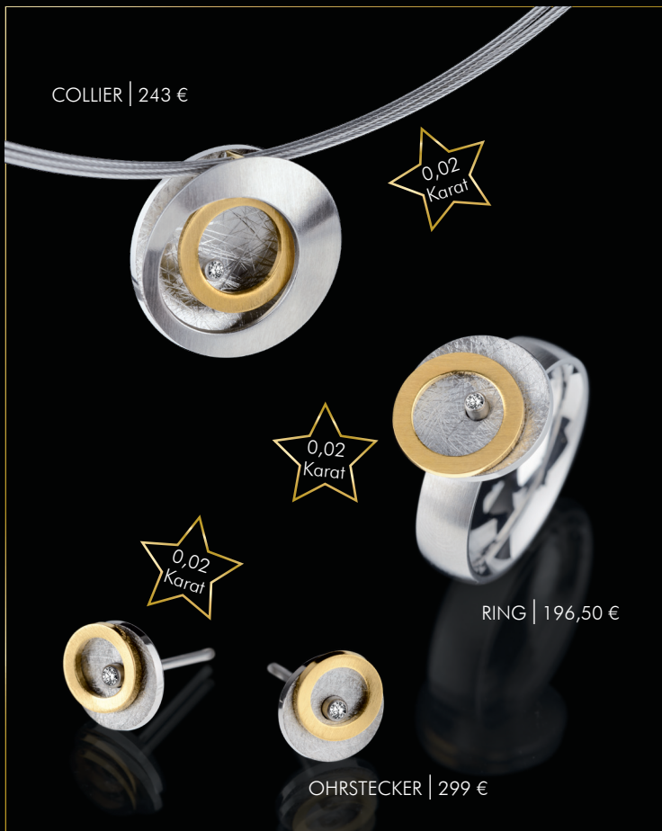
COLLIER | 243 €