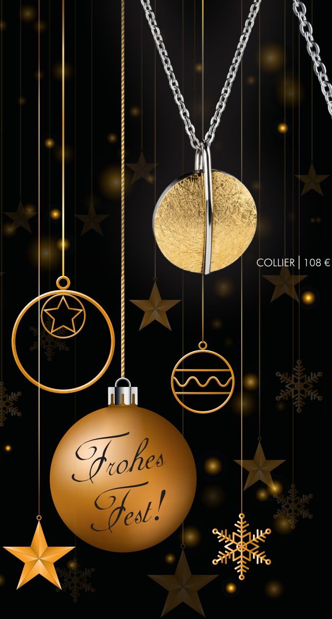
COLLIER | 108 €