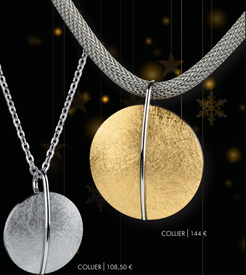
COLLIER | 144 €