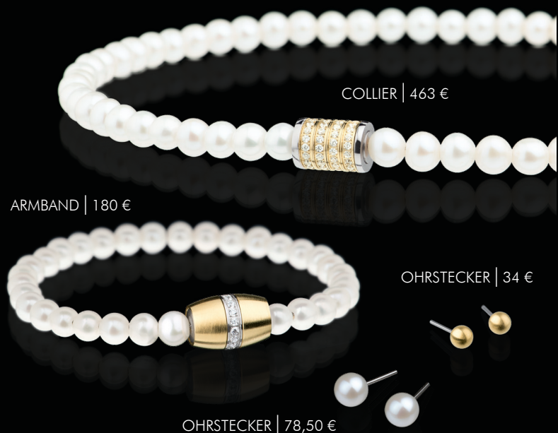
COLLIER | 463 €